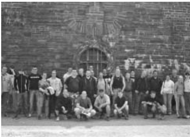
Nazis posieren in Vogelsang

„Blow it up“ hatte ein britischer Offizier nach Besichtigung der Ordensburg gefordert. Die britische Verwaltung verhandelte mit deutschen Stellen über das Material der zur Sprengung vorgesehenen Ordensburg (es sollte dem Klinikum in Bonn zu Gute kommen). Die britische Armee stellte die eigenen Leute vor vollendete Tatsachen, indem sie das Areal als Truppenübungsplatz reklamierte, den sie später den Belgiern übergab. Der Antifaschismus der alliierten Truppen war schlicht und effektiv. Die Nazi-Hoheitszeichen dienten als Schießscheibe, der Turm wurde zur Kletterwand umfunktioniert, das den Boden bedeckende Hakenkreuz wurde durch Matten abgedeckt. Mellers „Der deutsche Mensch“ verschwand. Die Deutschen haben 2006 als eine der ersten Handlungen die Matten