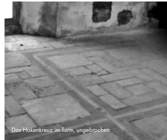
Das Hakenkreuz im Turm, ungebrochen

Dem Denkmalschutz der Ordensburg ist vorausgegangen der Streit um die Historikerdebatte über die Einmaligkeit der NS Verbrechen, der Streit um den Händedruck von Kohl und Reagan über den SS-Gräbern von Bitburg, um die Bedeutung des 9. November 1938 für die Erinnerungskultur der BRD angesichts steigenden Nationalismus und vor allem und direkt in die Argumentation eingehend der Streit über „Nazi-Kunst im Museum“. Der wohlhabende Kunstmäzen Ludwig hatte sich vom „Bildhauer des Führers“ Arno Breker ein Porträt anfertigen lassen, das er in den aus öffentlicher Hand bezahlten städtischen Kunsttempeln ausstellen wollte. Diese Debatte, als deren Antipode der Künstler Klaus Staeck gilt, fand nun Anwendung in Vogelsang. Obwohl die Experten von den Reliefs, Ornamenten und Skulpturen in Vogelsang selten anders als von Kitsch sprachen, fanden die Verantwortlichen in Köln es wichtig, den Schrott zu erhalten, damit die Gesellschaft sich damit auseinander setzen könne. Der Schutz der Nazi,„kunst“ gilt für die Gesamtanlage.