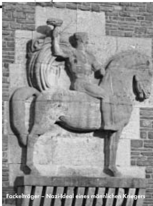
Fackelträger – Nazi-Ideal eines männlichen Kriegers

Wer den Charakter von Architektur und Nazi-„Kunst“ brechen will, muss die Perspektive der Opfer von Faschismus und Krieg miteinbeziehen. Es reicht keinesfalls, am Fackelträger eine Beschreibung der überlebensgroßen Skulptur aufzustellen. Das dort verkörperte Nazi-Ideal eines männlichen Kriegers muss kontrastiert