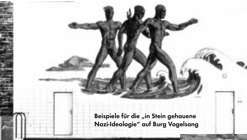
Beispiele für die „in Stein gehauene Nazi-Ideologie“ auf Burg Vogelsang

maligen und hohen Zeugniswert der Gesamtanlage ausmacht“ (S.27)