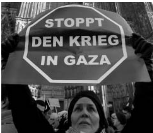
Demonstration in Köln am 10. Januar

Zu Zusammenstößen kam es, vor diesem Hintergrund (angesichts der Haltung eines Großteils des rechtsextremen Milieus) in Nizza, einer Stadt mit starker kolonialer und rechtsextremer Tradition. Eine pro-palästinensische Demonstration Anfang Januar 09, bei der vor allem arabischstämmige Personen waren, wurde von Balkonen aus mit Gegenständen beworfen. Daraufhin kam es zu Unruhen, bei denen unter anderem die Polizei angegriffen wurde. Am vorletzten Samstag (17. Januar)