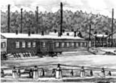
Hinzert bei Trier

BONN/KOBLENZ/MAINZ - Ungeachtet andauernder Widerstände der Deutschen Bahn AG, die dem „Zug der Erinnerung“ weitere Zwangsgebühren in Höhe mehrerer zehntausend Euro angedroht hat, beschloss die Bürgerinitiative jetzt einen neuen Fahrplan für das Gedenken. Erste Station der kommenden Strecke wird am Montag, 2. März, die Bundesstadt Bonn sein. Dort hat die „Gedenkstätte für die Bonner Opfer des Nationalsozialismus“ und eine Initiative von vielen Bonner Organisationen