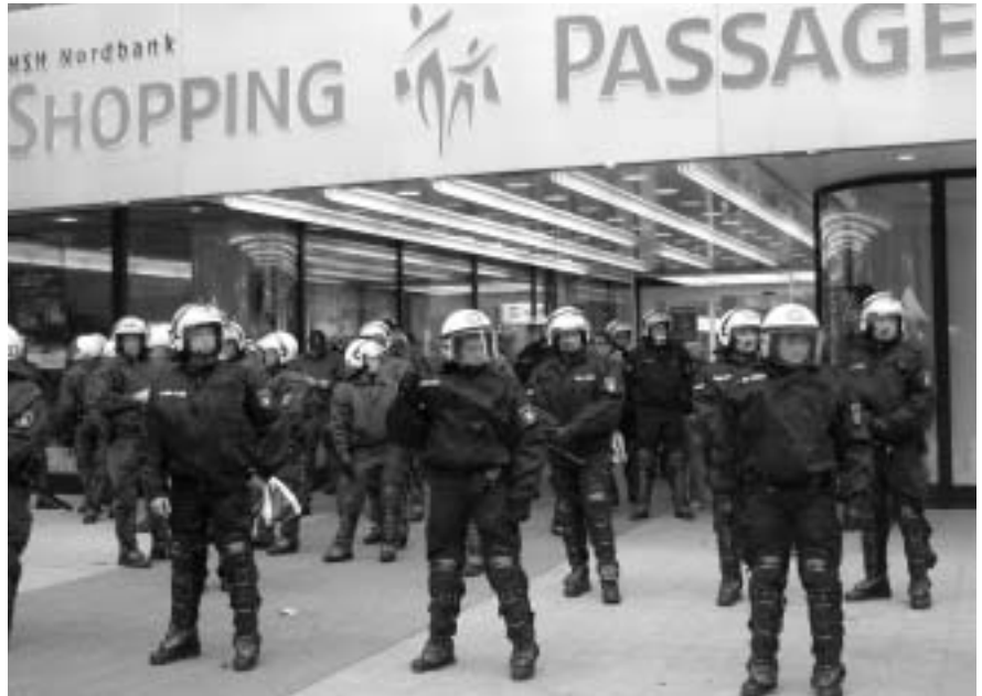
Tägliche Proteste gegen das Geschäft mit dem Nazichic