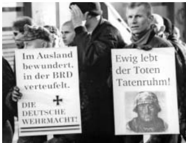
Neonazis protestieren während der Ausstellung zur Geschichte der Wehrmacht, Bild aus Kiel

griffe („Bombenholocaust“) oder als Heldengedenkmarsch zum größten deutschen Soldatenfriedhof in Halbe („Für die Tapferkeit und Opferbereitschaft des deutschen Soldaten“): Neonazis nehmen an offiziellen Gedenkveranstaltungen teil, sie legen Kränze an Kriegerdenkmälern nieder, reinigen und pflegen Kriegsgräberstätten. Mit der Ehrung der toten Soldaten und der Leugnung deutscher Verbrechen versuchen sie, den Nationalsozialismus und den Krieg zu verklären.