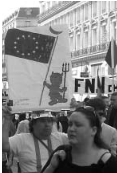
FN-Demo am 1. Mai 2005 in Paris

Im Parlament verkündete Sarkozy am 23. Juni offen, dass es um eine Gewinnung der rechtsextremen Wähler gehen: „Wir werden durch Taten die extreme Rechte, die Armut und die Gewalt zurückdrängen“. Sozialdemokratischen Opponenten hielt er vor: „Es wundert mich nicht, dass das Volk sich von ihnen abgewendet hat. Denn Sie haben das Volk vergessen. Sie sprechen nicht wie es, Sie verstehen es nicht und Sie ziehen keinerlei Konsequen-